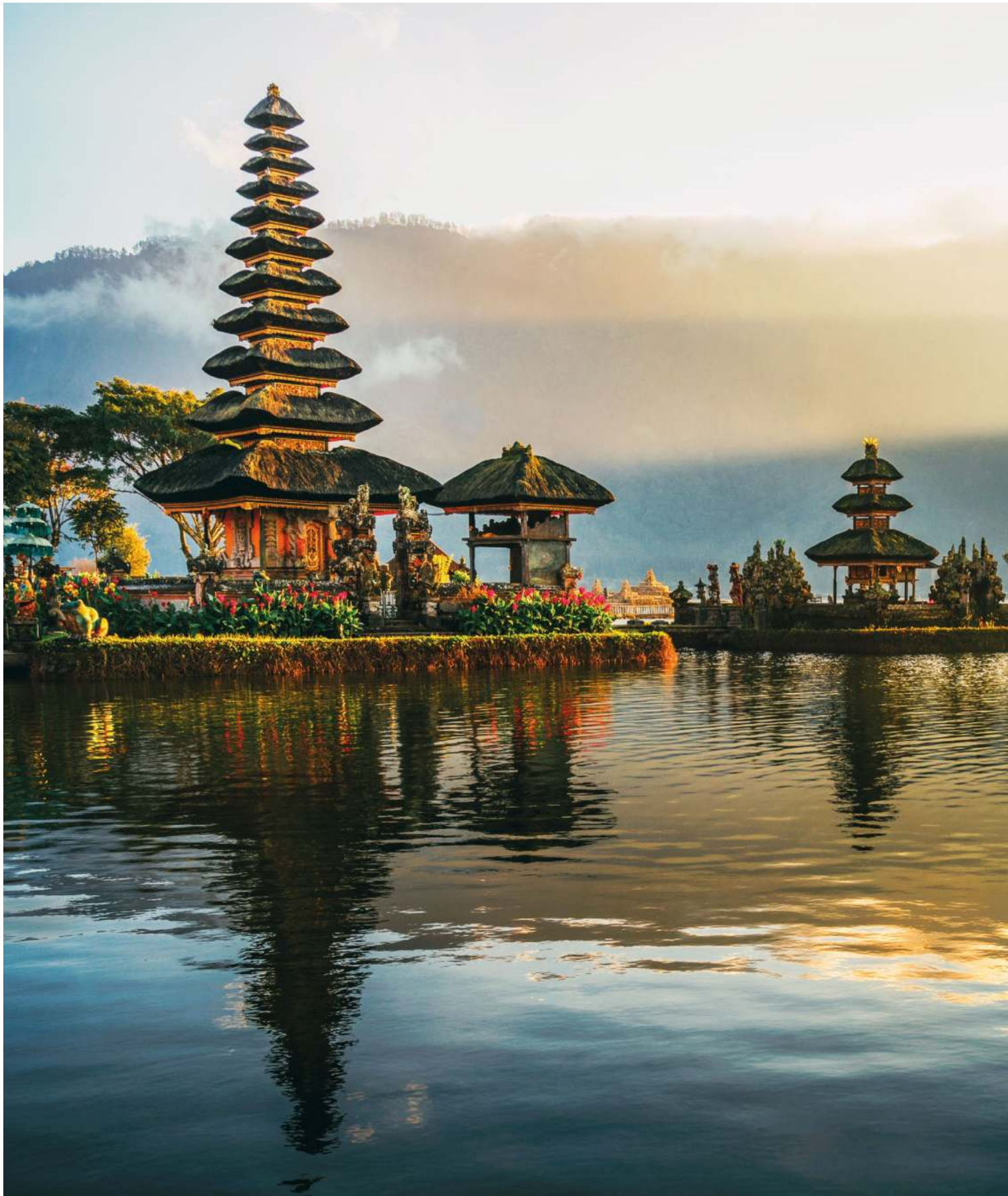
Ulun Danu Beratan Tempel bei Sonnenuntergang, Bratan, Bali, Indonesien